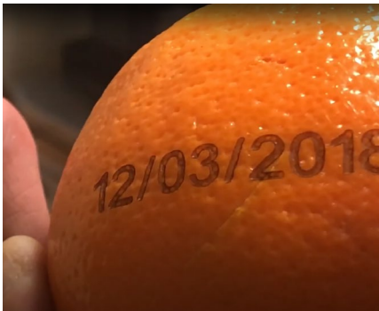
Markierung von Obst und Gemüse