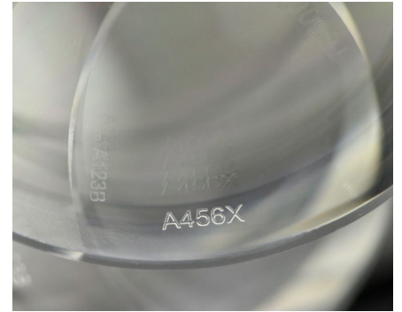
Erstellung von Etiketten