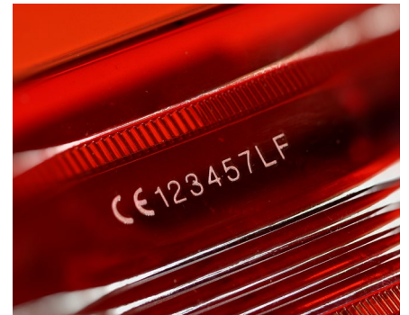
Beschriftung von Glas und durchsichtigen Kunststoffen